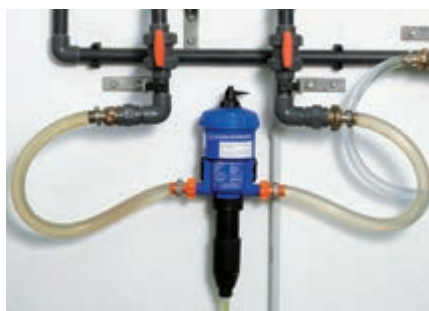
Medikator tip 1