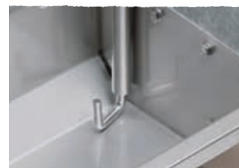
Protočna cijev pod vakuumom sa mješalicom J oblika za uzdužne valove

Protočne cijevi pod vakuumom za punjenje valova se koriste za krmače u uklještenjima ili u uzgajalištima. Voda se automatski dodaje kad svinje piju iz valova. Što je dulji red valova (max. 25 m po jednoj cijevi), to je ovaj sistem pojenja ekonomičniji.