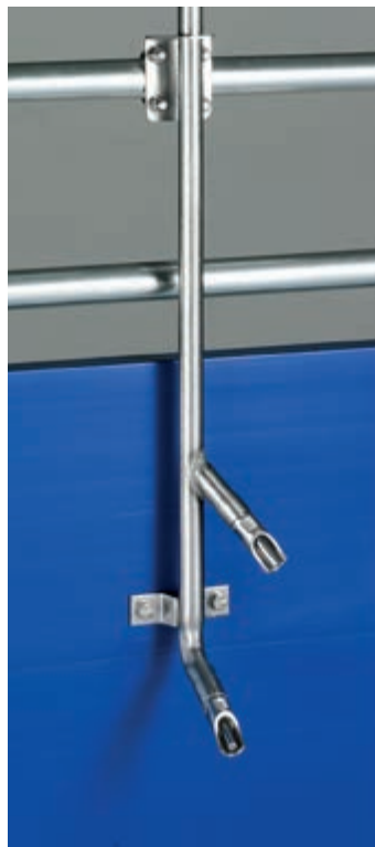
Nipl pojilica za tovljenike – visoki i niski pritisak – sa dvije niple na različitim visinama – za predtov i završni tov