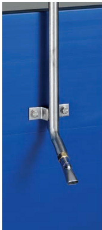
Nipl pojilica sa kuglicom za tovljenike – visoki pritisak – smanjen gubitak vode jer svinje moraju staviti cijelu niplu u usta kako bi mogle piti