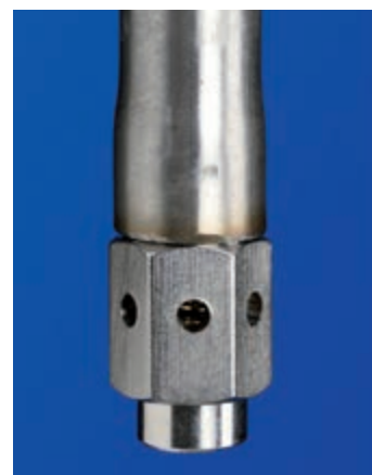
Nipla za vlaženje za krmače – visoki pritisak

Kao opcija su dostupne cijevi za pojenje sa zaštitom koja može biti i naknadno ugrađena. Zaštita štiti od ozljeđivanja svinja na nipl pojilicu, na primjer kad tovljenici za klanje izlaze iz obora.