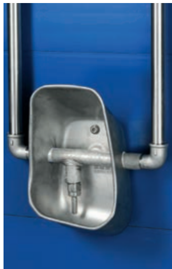
Posuda za pojenje sa cirkulacijom vode za odojke do 35 kg