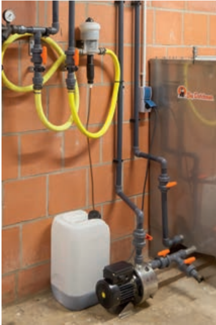
Tekući lijekovi se direktno uvlače