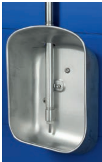
Posuda za pojenje za tovljenike