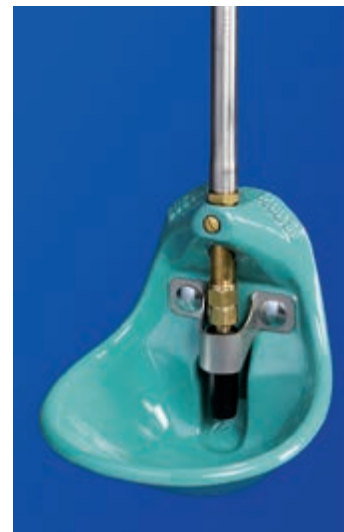
Posuda za pojenje sa zaštlćenim ventilom za prasilišta