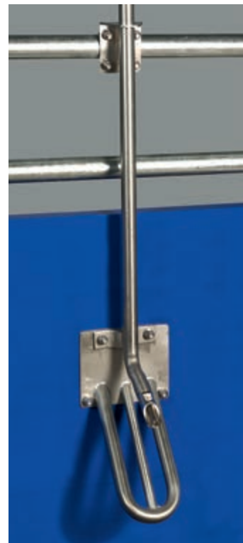
Ugradbena zaštita – za odojke i tovljenike