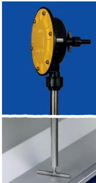
Protočna cijev pod vakuumom sa mješalicom T oblika za uzdužne valove – visoki pritisak

Protočne cijevi pod vakuumom za punjenje valova se koriste za krmače u uklještenjima ili u uzgajalištima. Voda se automatski dodaje kad svinje piju iz valova. Što je dulji red valova (max. 25 m po jednoj cijevi), to je ovaj sistem pojenja ekonomičniji.