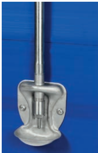
Posuda za pojenje za odojke koji sisaju