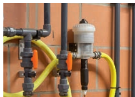
Medikator tip 3 (otpornost na kiseline)