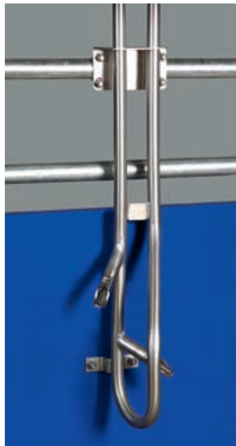
Cijev za pojenje sa cirkulacijom vode