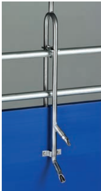
Cijev za pojenje za simultanu opskrbu dva obora

posude za pojenje. Sve nipl pojilice kao i cijevi za pojenje su izrađene od nehrđajućeg čelika i zbog toga imaju dug radni vijek.