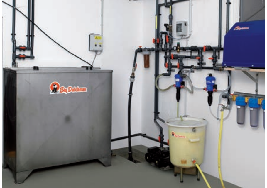
Servisna soba sa malim (60 l) i velikom (1000 l) spremnikom za miješanje lijekova od nehrđajućeg čelika

Tekući lijekovi se uvlače direktno iz originalnog pakiranja. Ako se koriste praškasti ili viskozni materijali, trebalo bi se koristiti spremnik za miješanje lijekova sa pumpom sa rotirajućim krilcima