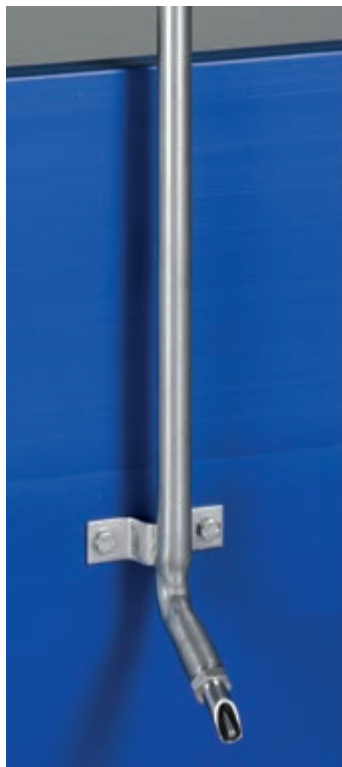
Nipl pojilica za odojke – visoki i niski pritisak – jednostavna za upotrebu od prvog dana